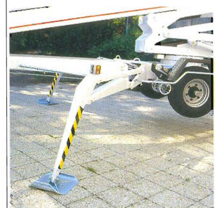
Das einmalige Abstützsystem ermöglicht das Aufstellen auch in schwierigem Gelände bei geringen Abstützmaßen.