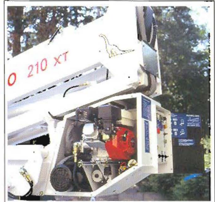
Zwei voneinander unabhängige Antriebsarten, 230 Volt Elektroantrieb und mittels Benzinmotor mit Extrapumpe, für alle Funktionen des Dino 210 XT