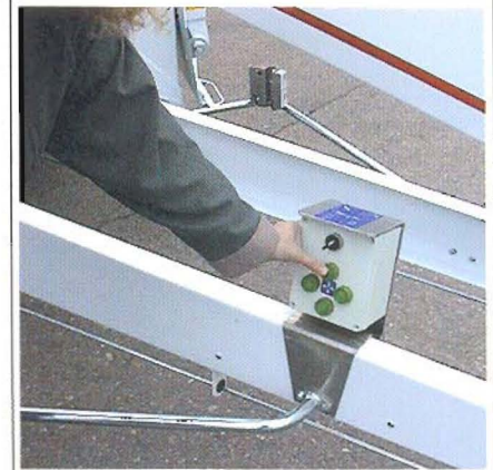
Seitlich an der Zugdeichsel befindet sich das Bedienpult für die Betätigung des hydraulischen Fahrtriebs zum leichten manövrieren der Maschine.